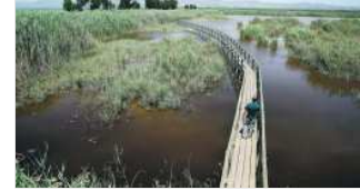
ZONAS HÚMEDAS. Un hombre cruza un puente del espacio natural de El Hondo, situado en los términos municipales de Elche y Crevillente.

Este proyecto define la nueva política del paisaje con un objetivo esencial: "Poner en valor el territorio, abrir nuevas oportunidades y crear fórmulas de desarrollo social y económico más sostenibles e innovadoras, basadas en conservar, mejorar y potenciar la calidad de los paisajes, tanto de los naturales como de los urbanos, de los agrarios y de los industriales, de los culturales y los históricos». Según el conseller de Medio Ambiente, el paisaje no es sólo lo que permite identificar un territorio como algo único, es también un factor de calidad de vida, y un recurso económico, un activo territorial, un factor de desarrollo y de competitividad cada vez más importante.